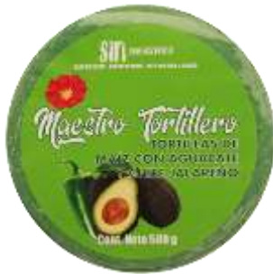
FOTO DE EMPAQUE