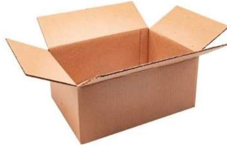
FOTO DE EMBALAJE