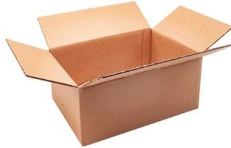
FOTO DE EMBALAJE