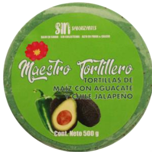
FOTO DE EMPAQUE