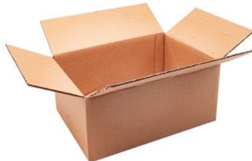
FOTO DE EMBALAJE