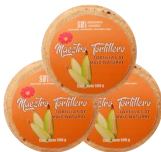
FOTO DE EMPAQUE