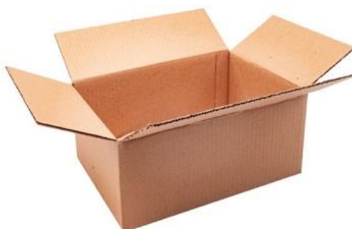
FOTO DE EMBALAJE