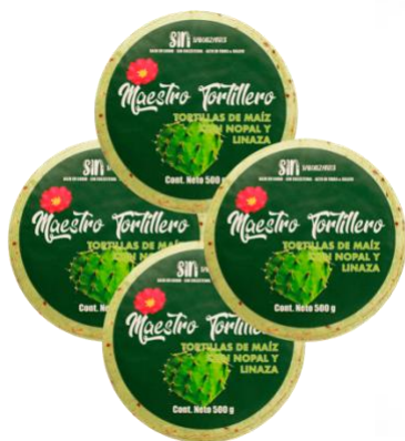
FOTO DE EMPAQUE