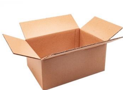
FOTO DE EMBALAJE