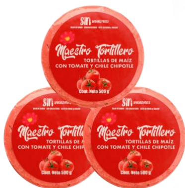
FOTO DE EMPAQUE