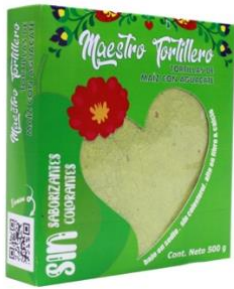
FOTO DE EMPAQUE