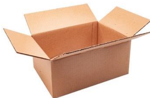
FOTO DE EMBALAJE