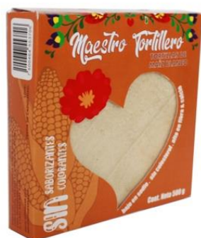
FOTO DE EMPAQUE