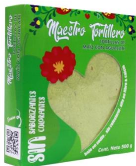
FOTO DE EMPAQUE