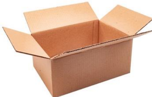
FOTO DE EMBALAJE