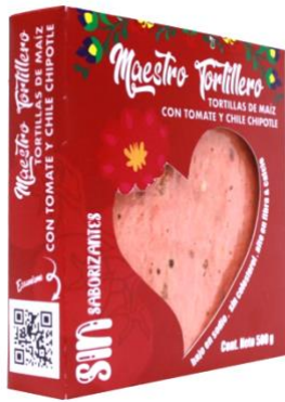
FOTO DE EMPAQUE