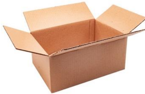
FOTO DE EMBALAJE